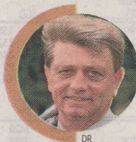
Par ALAIN MADELIN Ancien ministre