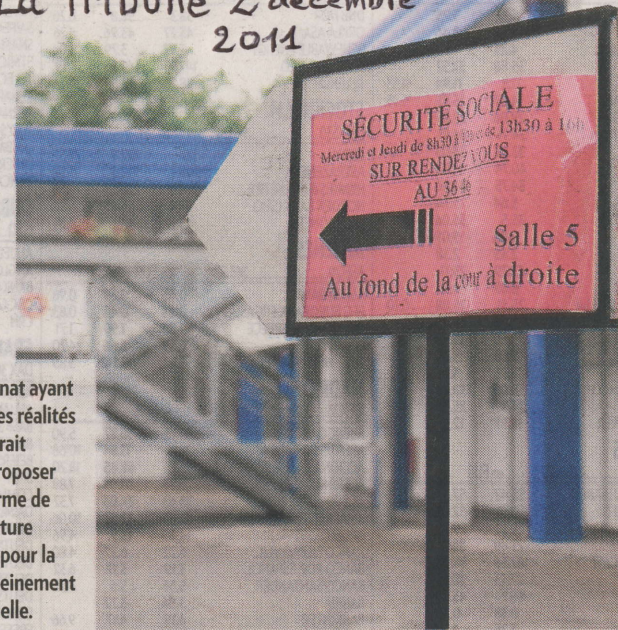
MARTA NASCIMENTO / IREA

La France a besoin d'organisations patronales dialoguant avec les syndicats et les pouvoirs publics, pour inventer l'échange social de l'avenir. Affronter loyalement le problème du coût du travail, ou tendre leur sésame au maître de la TVA, ces organisations ont un choix à faire!